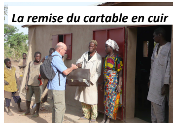
La remise du cartable en cuir