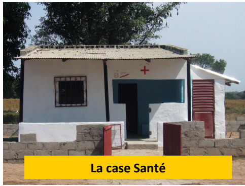
La case Santé

La case santé du village de Samtoulou, dont le gros œuvre était achevé depuis une année, attendait avec une certaine impatience les travaux de finition afin d'être opérationnelle. Les premières démarches consistaient à approvisionner le chantier en matériaux et outillages, tâches rendues difficiles par l'éloignement des lieux d'approvisionnement, la rareté de certaines matières et une portion de piste d'accès difficile... Il a fallu se procurer : sable, gravier, ciment, chevrons, peinture et outillages divers... Camions, motos et même, charrettes tractées par ânes, ont été mis à contribution pour l'acheminement de tous ces matériaux !!!