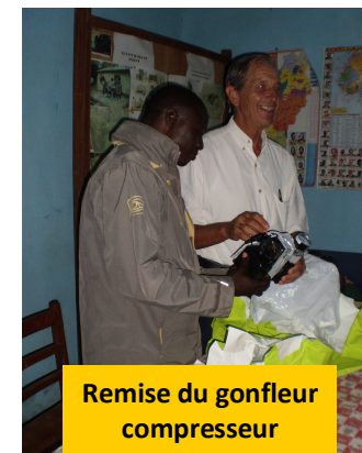
Remise du gonfleur compresseur