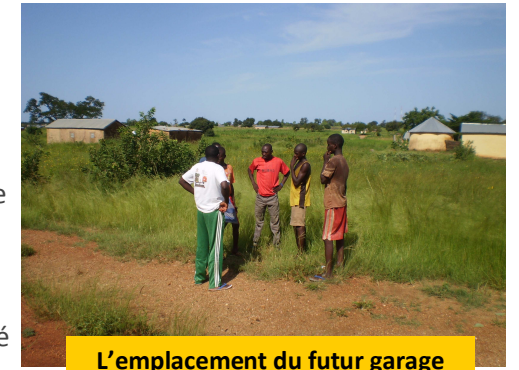
L'emplacement du futur garage