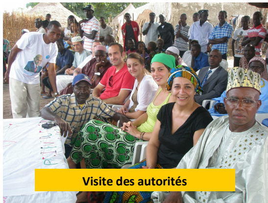
Visite des autorités

parpaings destinés à la construction du muret entourant la case santé et protégeant les futurs panneaux solaires, qui viendront alimenter un réfrigérateur et l'éclairage de cette case.