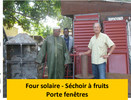
Four solaire - Séchoir à fruits Porte fenêtres