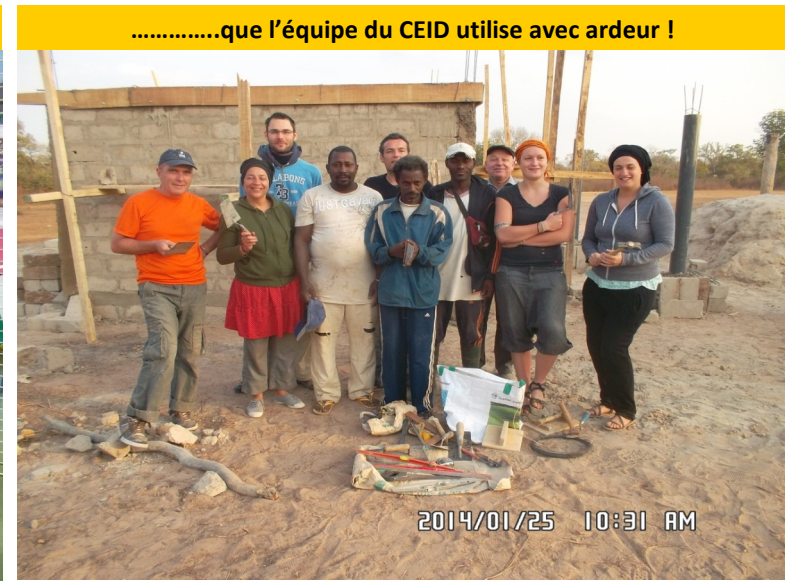
.....que l'équipe du CEID utilise avec ardeur !